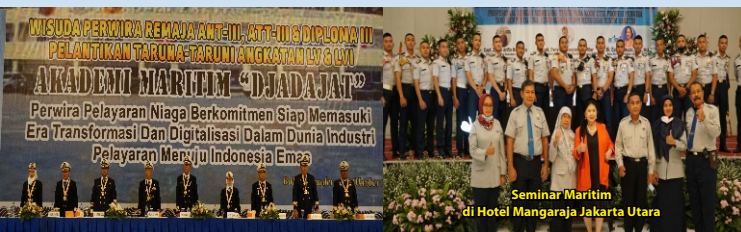
Seminar Maritim di Hotel Mangaraja Jakarta Utara