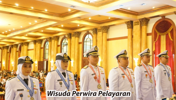
Wisuda Perwira Pelayaran